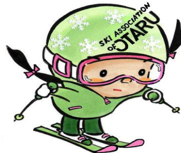
本校のマスコット「タルちゃん」